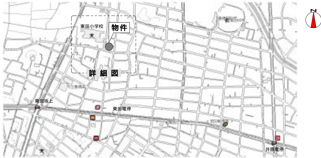
- 現地案内図 -