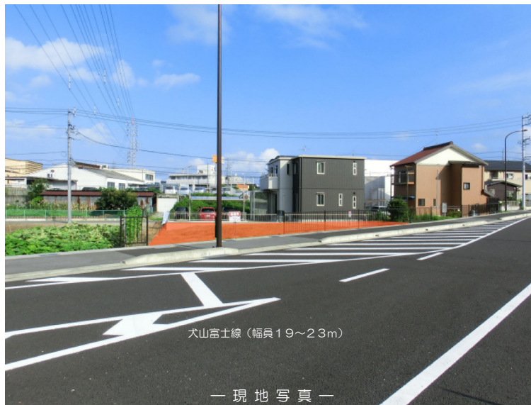
— 現地写真 —