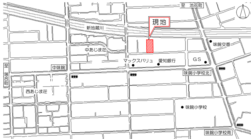
— 現地案内図 —